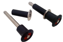
Système d'ancrage amovible (en option)