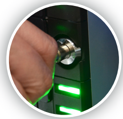
Bloqueur d'accès interne à la caisse